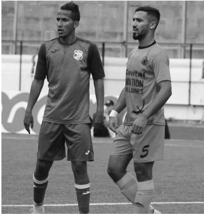
Certes, mathématiquement, rien n'est encore perdu pour l'accession, mais ce sera difficile pour l'US Béni Douala, surtout que le leader, le RC Arbaâ, jouera chez lui face au NARB Réghaïa, tandis

Bien qu'ils aient perdu presque toutes leurs chances d'accéder en Ligue 2 Mobilis, les Ath Douala sont appelés à rebondir cet après-midi au stade Abdelkader Zerrouki de Khemis El-Khechna.